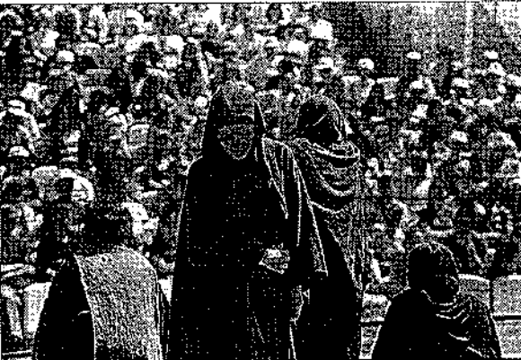
Imagen de una de las representaciones que tuvo lugar en el auditorio

El tiempo se volvió ayer de buen humor, aunque cada vez da un paso más para repetir. La semana anterior envió en los chicos que, repartidos en grupos para sus clases, recorrieron el centro, arribó, calle abajo por los rincones más oscuros de la ciudad.