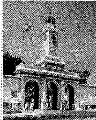
ARSENAL. Puerta abolicista y torre juratoria del ingeniero Tallarín. 1.965

OMNIA PRIUS EXPERIRI QUAM ARMA SAPIENTEM DECET