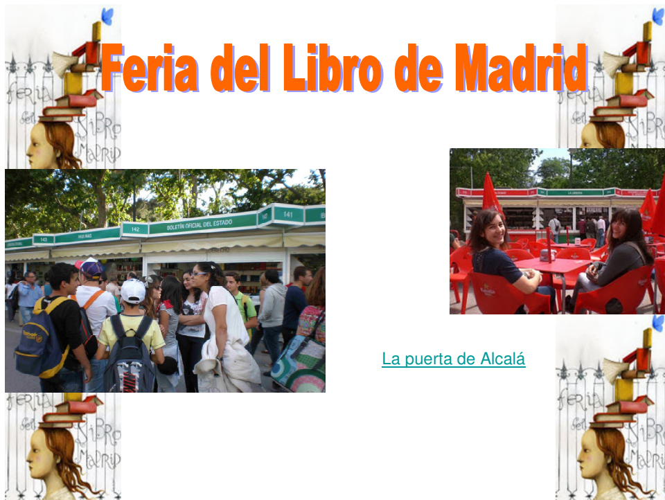
La puerta de Alcalá