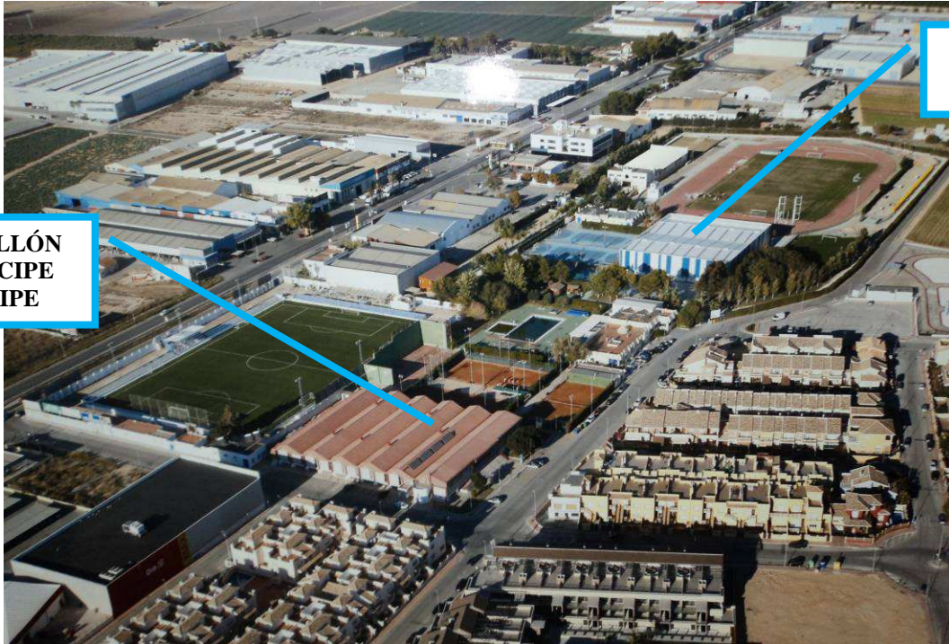
PABELLÓN PRÍNCIPE FELIPE