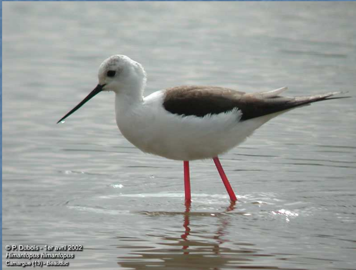
1er avril 2002 Himantopus himantopus Camargue (13) - Beauduc