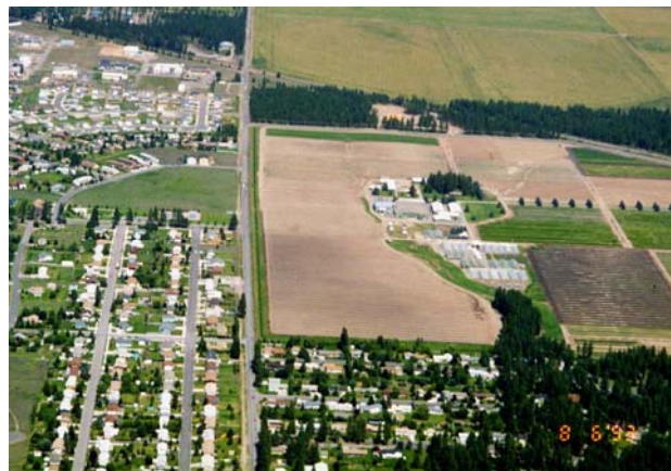
Figura 1.2.5. Los viveros que fueron originalmente establecidos en el perímetro de áreas urbanas, comúnmente son rodeados por el crecimiento de las ciudades (Cortesía de Tim McConnell, Servicio Forestal de los Estados Unidos).

vender excedentes de terrenos en algún momento futuro, que tratar de adquirir un área para una posible expansión, o intentar operar desde dos sitios diferentes. Muchos de los viveros han sido desarrollados en áreas rurales, solamente para encontrarse rodeados por las construcciones urbanas pocos años después (fig. 1.2.5).