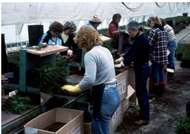
Figura 1.2.8 La mano de obra local debe ser adecuada para satisfacer al vivero durante los periodos críticos, tales como la cosecha y el empaclado.

El número de empleados requeridos depende del tamaño y de la complejidad de las operaciones. En promedio y como una regla práctica, se necesita de un trabajador por cada 200,000 plantas, y al menos un supervisor técnico por cada 3,000,000 de plantas. Los viveros también pueden considerar la contratación de una persona adicional, como un supervisor auxiliar.