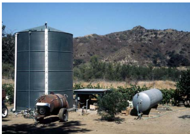
Figura 1.2.4 Si el gasto del pozo o de las corrientes superficiales no es suficiente para satisfacer los requerimientos máximos de riego, será necesario construir embalses o tanques de almacenamiento.

Fuentes: Encuesta de Viveros en Contenedor, Hahn (1977), Mathews (1983), y Tinus y McDonald (1979).