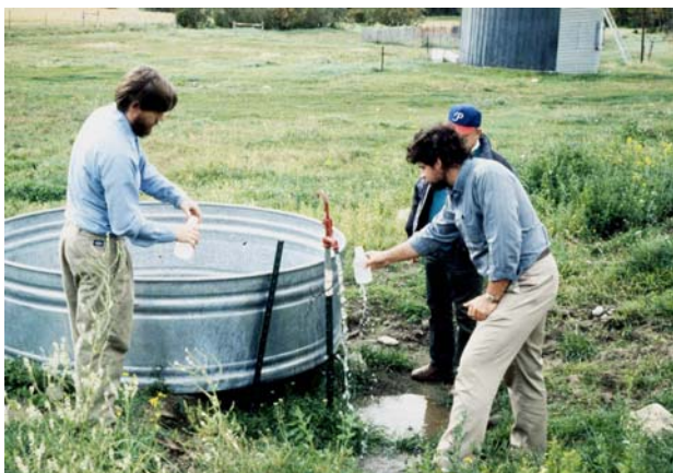
Figura 1.2.3 El primer paso para la determinación del área adecuada para el establecimiento de un vivero, es el coleccionar muestras del agua de riego de todas las fuentes potenciales y obtener su análisis completo.

requerimientos en cuanto a los estanques y cisternas de almacenamiento.