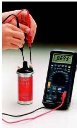
▶ Medición del enrollamiento secundario