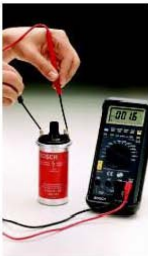
◀ Medición del enrollamiento primario