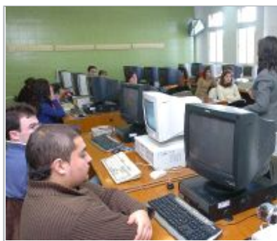
EN EL AULA. Los alumnos de Comercio Exterior, durante la sesión informativa.