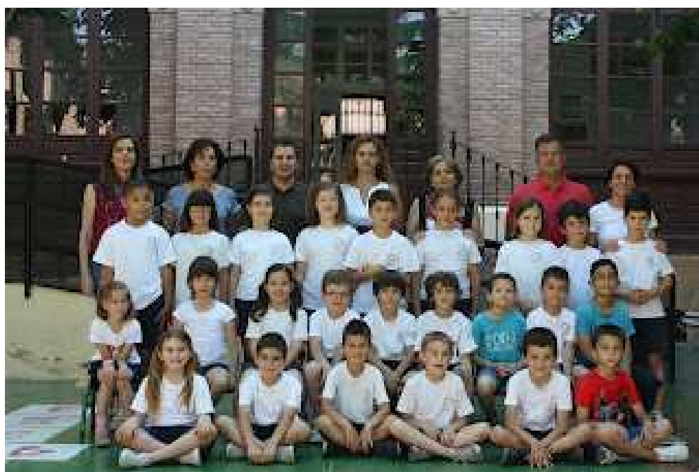
Alumnos del CEIP Cierva Peñafiel de Murcia