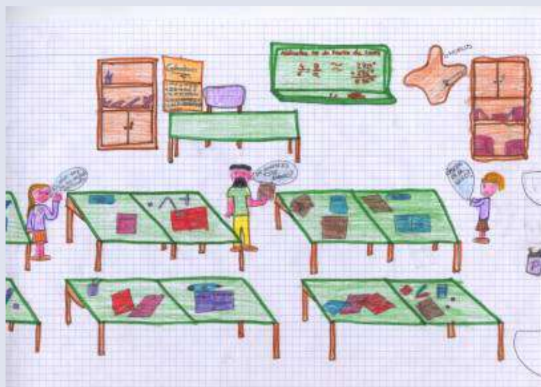
dibujo de un alumno español sobre su colegio