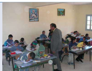
actividades en el aula (colegio sidi moussa)

los más pequeños entonando canciones sobre la paz