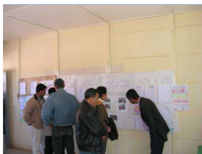
exposición de trabajos en el colegio marroquí

los más pequeños entonando canciones sobre la paz